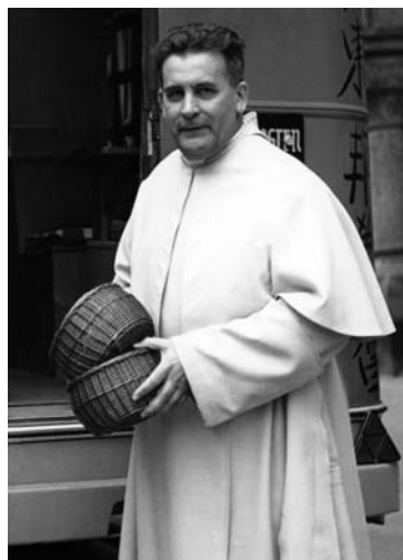
Pater Werenfried bei einer Predigtaktion.

Anfang 2004 hat der deutsche Zweig von KIRCHE IN NOT ein eigenes Radiostudio in München eingerichtet, in dem regelmäßig die Sendung „Weltkirche aktuell“ für Radio Horeb und andere Sender produziert wird. Seit Mitte 2004 produziert KIRCHE IN NOT die TV-Gesprächsmagazine „Weitblick“ und „Spirit“. Die Sendung „Weitblick“ berichtet aus Ländern und Regionen der Erde, bei denen nicht touristische oder vordergründig politische Aspekte gezeigt werden, sondern die geistige und geistliche Entwicklung eines Landes. Die Sendereihe „Spirit“ soll den Zuschauern Anregungen zu einem christlichen Lebensstil geben, in einer Welt, die zunehmend von einer „Diktatur des Relativismus“ (Papst Benedikt XVI.) regiert wird. Der Stifter der Päpstlichen Stiftung KIRCHE IN NOT, Papst Benedikt XVI., ließ uns 2007 wissen: „Der Medienbereich verlangt besondere Aufmerksamkeit zur Weitergabe der Frohen Botschaft.“